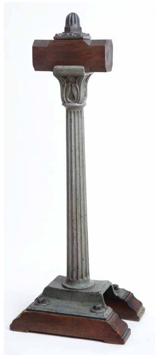
A híd felújításakor emléktárgyként kiemelt korlátélelem

Több Lánchíd-emléktárgyat őriz a Kiscelli Múzeum Műszaki gyűjteménye is: ezek között megtalálhatók különböző öntöttvas korlátadarabok és csavarfej-díszgombok is.