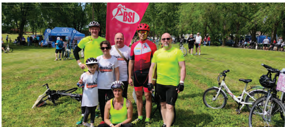
Fáradtan, de mosolygósan a Tour de Tisza-tó után

Idei második kerékpáros eseményünk a BSI által szervezett Tour de Tisza-tó volt, ahol bevállaltuk a 15 km-es és a 65 km-es távot is. Tekertünk és gurultunk is, ki szélsebesen, ki kényelmesen, gyönyörködve a táj szépségében, körbejárva a Tisza-tavat. Kicsit fáradtan, de mosolygósan mindenki sikeresen célba ért.