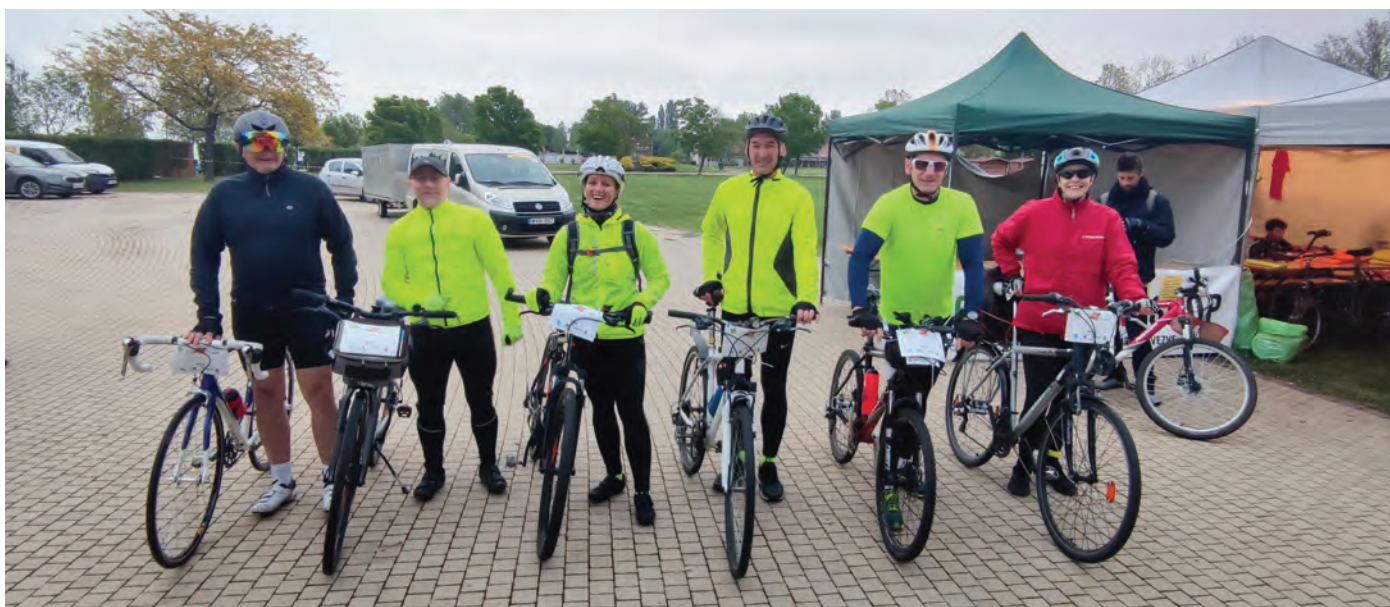
206 km-es Balatonkőr